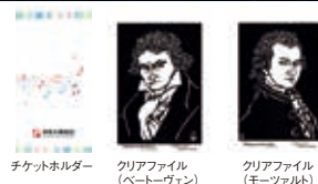
チケットホルダー

特別鑑賞回数券をご利用いただく場合には、予約受付期間中に電話予約が必要となります。