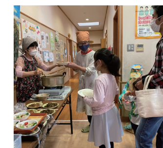
子ども食堂の様子

ハウス食品グループでは、共食機会の創出を通じて孤食や不健全な食習慣を解決したいという思いから、認定NPO法人全国子ども食堂支援センター・むすびえを通じて、子ども食堂支援活動に取り組んでいます。株主様からの株主優待を通じたご寄付を元にした助成「ハウス食品グループ本社・子ども食堂基金mini」およびグループの製品や社員のメッセージをお届けする「えがお便」で、全国の子ども食堂を支援しております。